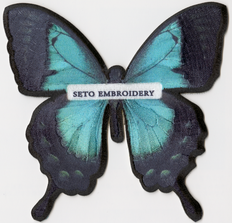
CASE 02 | 写真以上の光沢感を実現

刺繍とプリントを組み合わせることで、 今までにないワッペンが作成可能になりました。 組み合わせ次第で無限に広がる加工パターン。 そのほんの一部をご覧ください。