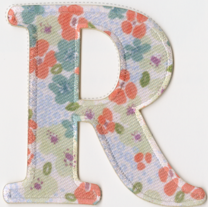
CASE 01 | 色々な柄の アルファベットワッペンも可能