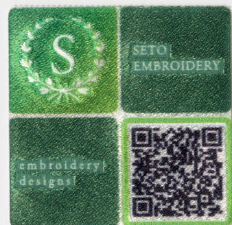
CASE 07 | QRコード付きのワッペン