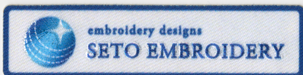
CASE 06 | グラデーションの会社ロゴを刺繍