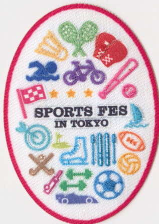
CASE 04 | 多色刺繍を 自由自在に表現