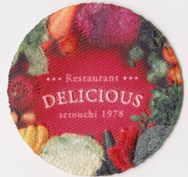
CASE 05 | 写真画像を発色よく表現